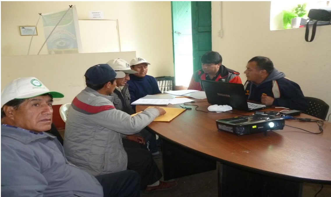
PARTICIPACION DE LOS BENEFICIARIOS EN LOS COMITES DE EVALUACION Y ADJUDICACION DE LAS OBRAS