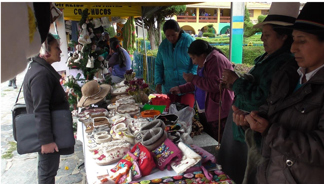
PROYECTO "PILOTO PARA EL DESARROLLO DE LA ARTESANIA EN LA COMUNIDADES CAMPESINAS DE CONCHUCOS Y PAMPAS"