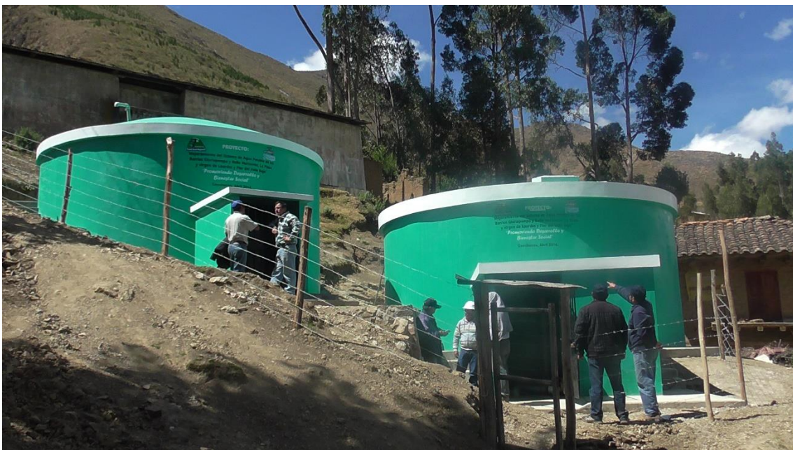
PROYECTO “MEJORAMIENTO DEL SISTEMA DE AGUA POTABLE DE LOS BARRIOS GLORIAPAMPA Y BELLO HORIZONTE, LA PLAZA Y VIRGEN DE LOURDES Y FLOR DEL VALLE BAJO”