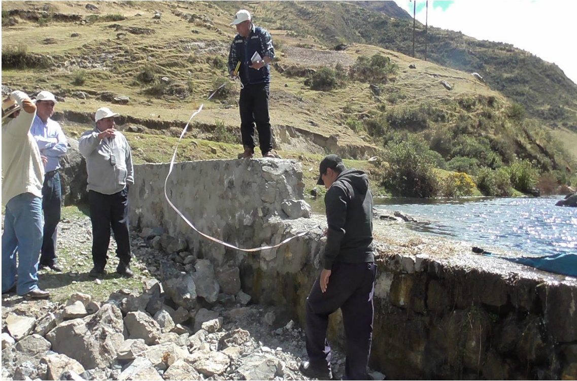
PROYECTO "CREACION DEL CANAL LLAMACOA, DISTRITO CONCHUCOS, PROVINCIA PALLASCA, REGION ANCASH"