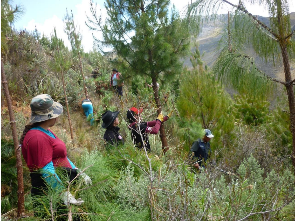
PROYECTO "INSTALACION Y PRODUCCION DE PLANTONES FORESTALES EN EL SECTOR CONTADERA, DISTRITO CONCHUCOS, PROVINCIA PALLASCA, DEPARTAMENTO ANCASH"