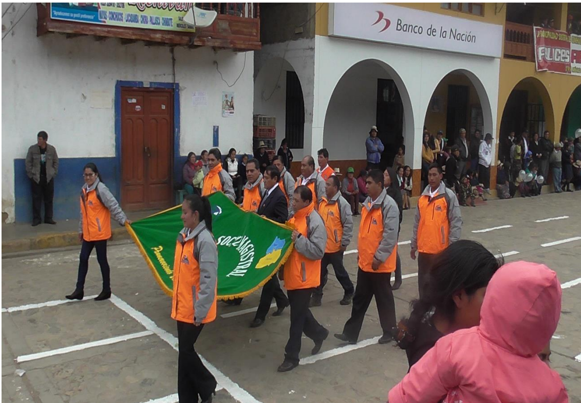
DELEGACION DEL FOSMAG, EN DESFILE PATRIOTICO DEL 28 DE JULIO 2014, EN CONCHUCOS