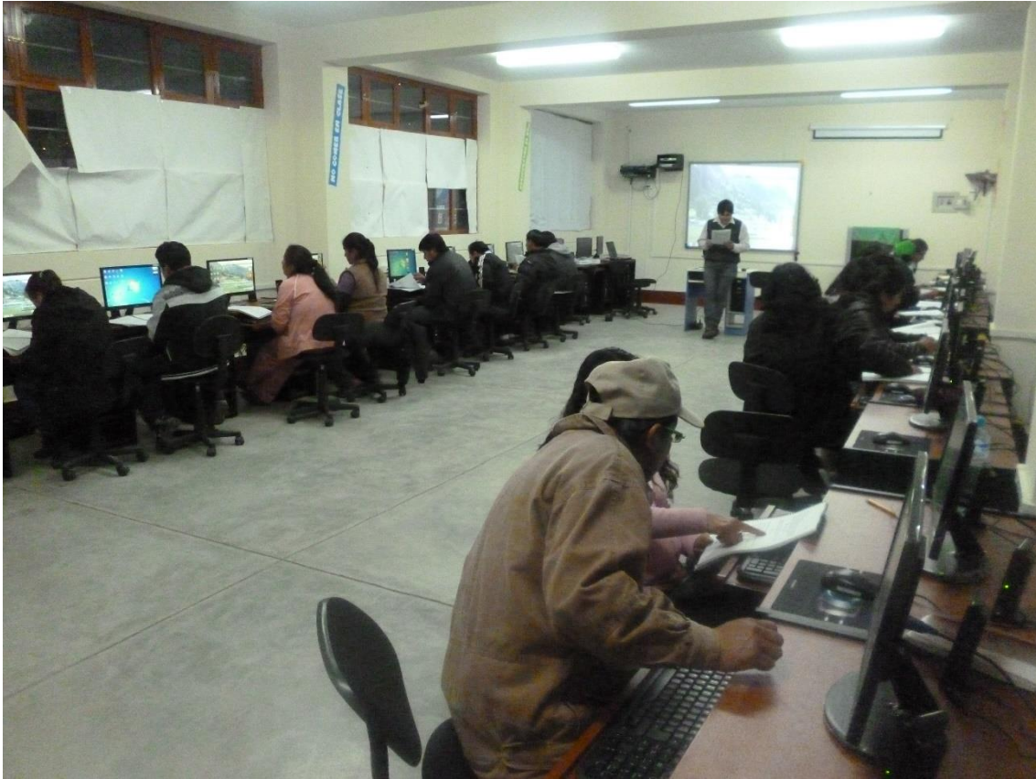
PROYECTO “FORTALECIMIENTO DE CAPACIDADES EN MANEJO DE TECNOLOGÍAS DE INFORMACIÓN Y COMUNICACIÓN, EN INSTITUCIONES EDUCATIVAS DE PAMPAS”