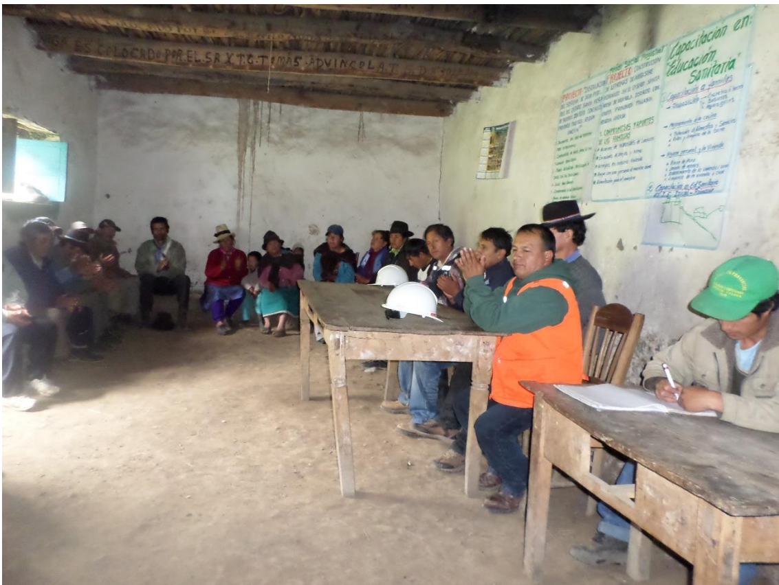
REUNIONES PERMANENTES DE COORDINACION DEL FOSMAG Y SUS DIRECTIVOS, CON LOS BENEFICIARIOS