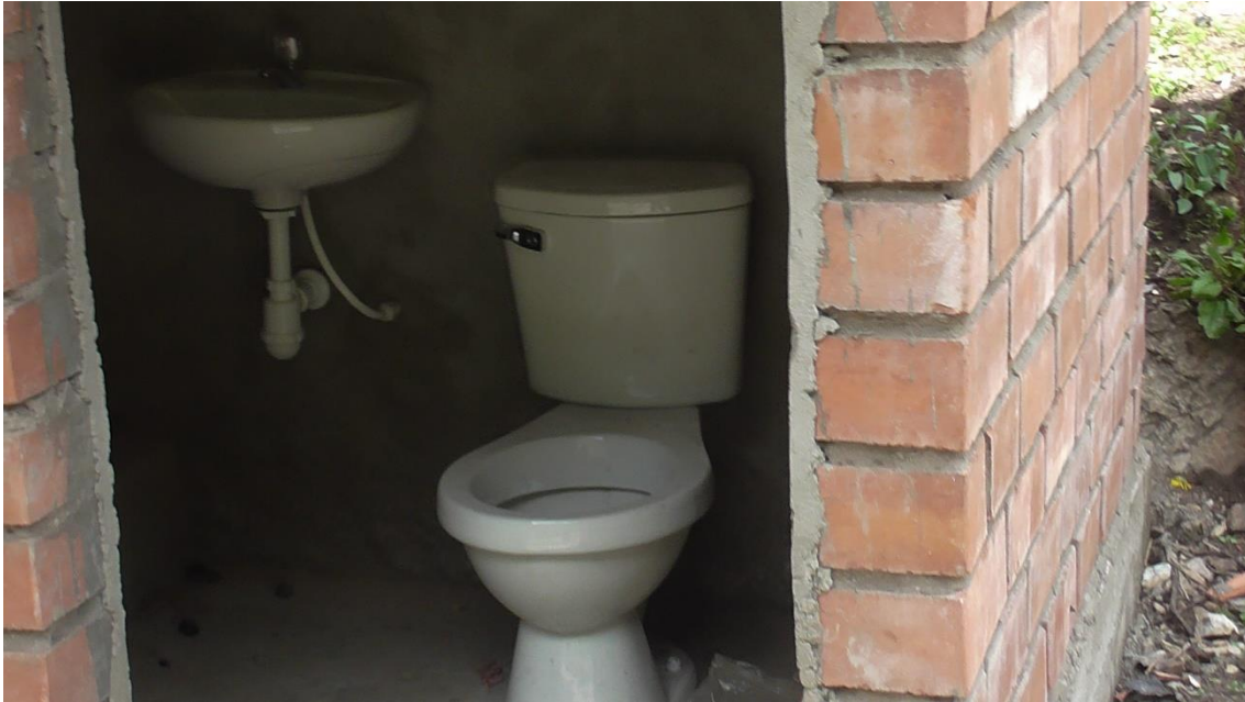
PROYECTO “CONSTRUCCION DE LETRINAS DE ARRASTRE HIDRAULICO EN HUASHLA”